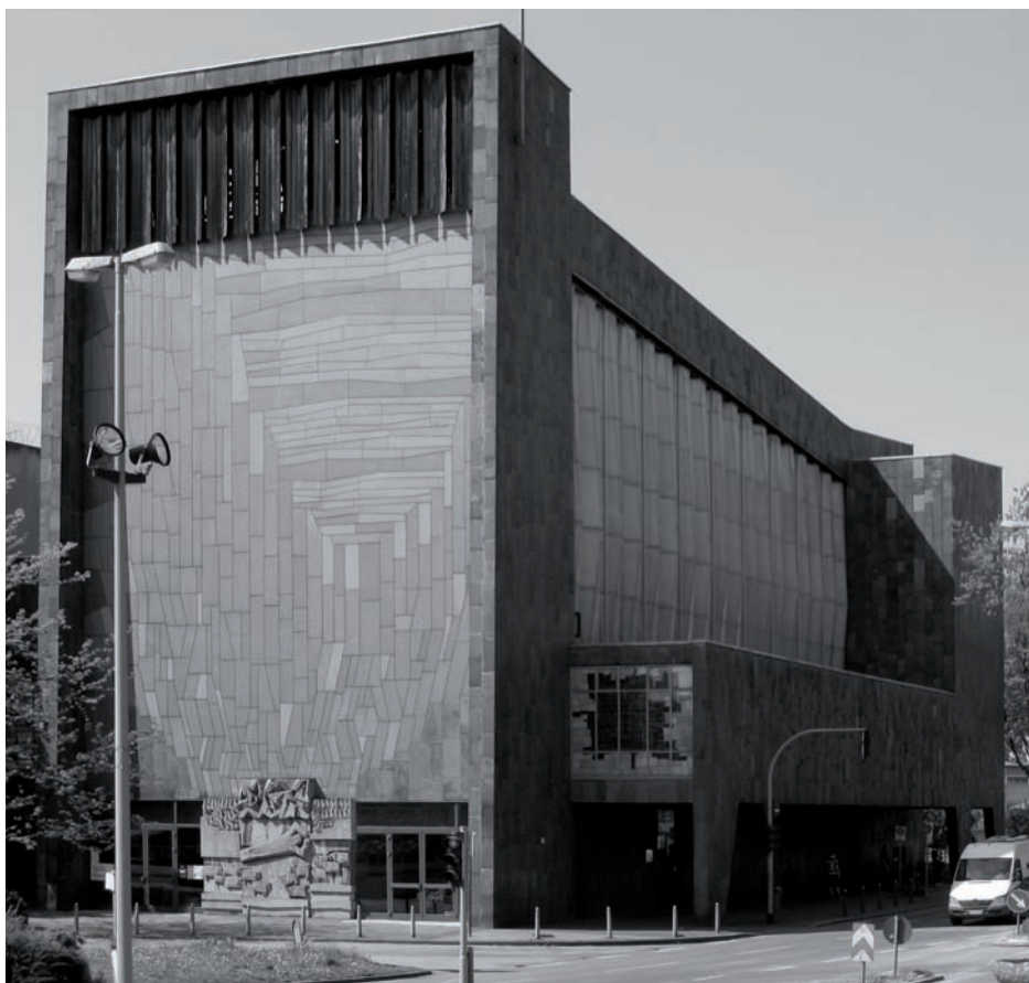
1 u 3 Lichtband im Hauptschiff der Liebfrauenkirche

Die Liebfrauenkirche zeigt jedoch, dass die Architektur der 60er mehr war als Beton, Verdichtung und Großform. Architektonisches Schaffen fand nach dem notwendigen Wiederaufbau der Nachkriegszeit zu einem eigenen Ausdruck: Fortschritts-glaube , Wirtschaftswunder , eine neue Rolle auf internationalem Parkett waren die Motoren für eine Neupositionierung der Architektur. Das Experimentieren mit neuen Baustoffen und Formen waren Momente einer Baukunst , die sich demonstrativ lossagte von der Vergangenheit .